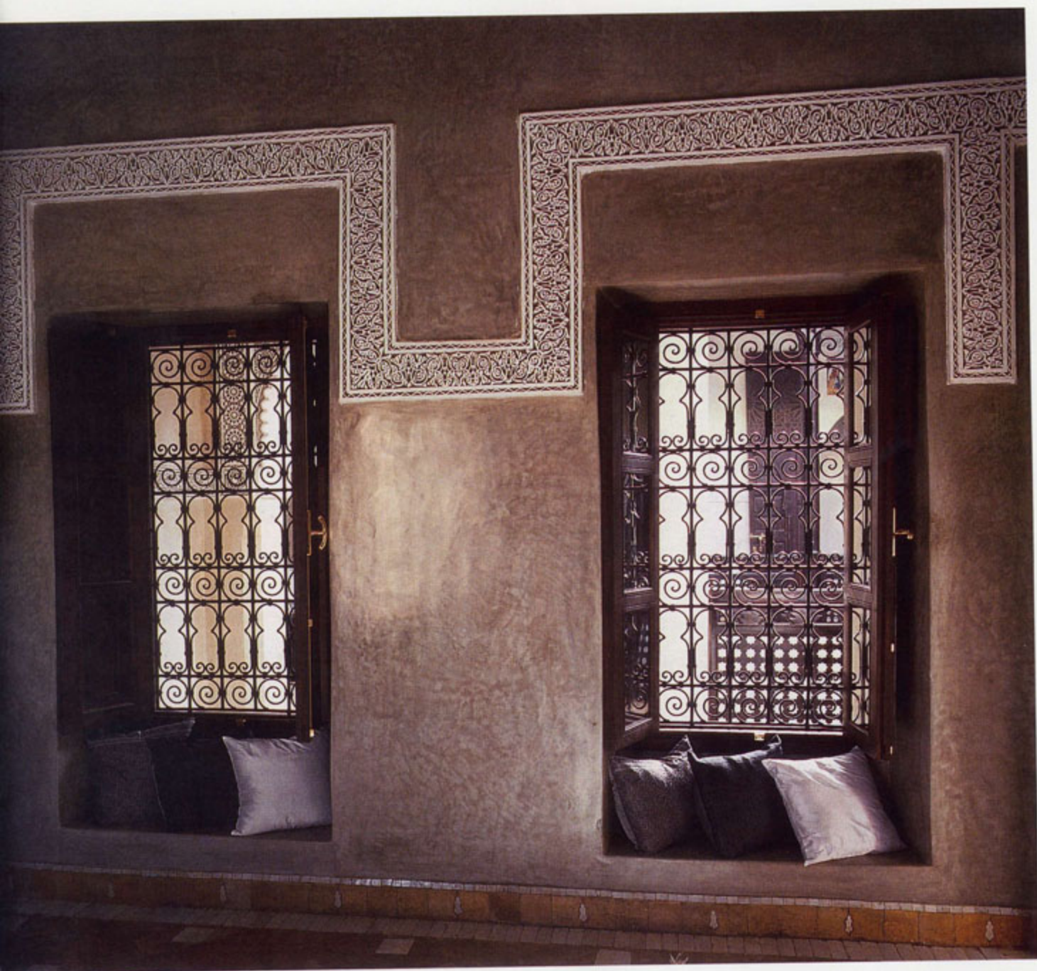
A gauche et ci-dessus, deux vues de la chambre silver, aux murs recouverts d'un somptueux tadelakt et de plâtre finement ciselé. Aux fenêtres donnant sur le patio, le fer forgé assure une intimité luxueuse.